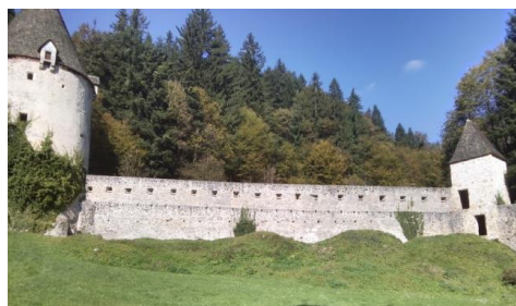
Slika 3: SV zid s stolpoma

Najina skupina je izdelala posnetek zidu in stolpov na SV samostana. Na objektih so bili številni detajli, za katere smo porabili veliko časa. Predvsem za merjenje višin smo uporabili tahimeter. Pred meritvami pa smo si naredili skice objektov ter posameznih detajlov, zraven katerih smo si zabeležili mere. Ko smo narisali skice in naredili vse potrebne izmere,