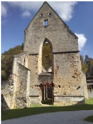
Slika 2: Ostanek cerkve

9. 10. 2014 smo se dijaki 3.Bo in 5.Ta – program gradbeni tehnik - odpravili na terenske vaje in ogled kartuzijanskega samostana Žiče. Najprej smo se ustavili v Špitaliču, kjer je bil nekoč spodnji samostan. Ogledali smo si zunanost in notranost cerkve Marijinega obiskanja nakar smo se odpravili v zgornji samostan.