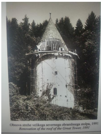
Slika 4: Slika z razstavnega panoja

Po skupnem ogledu samostanskega kompleksa smo se osredotočili na določene objekte ter pričeli z delom. Vsaka skupina je poleg risarskega orodja uporabljala metre ter geodetski instrument tahimeter. Izmerili smo fasade vseh delov samostana: obzidje, stolpe, stavbe, cerkev, kapelo in tudi detajle.