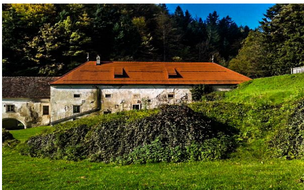
Slika 2: Severovzhodna fasada kašče; (foto: Jan Kerčmar)

S tem merjenjem smo pridobili izkušnje, se spoznali z zgodovino Žičke kartuzije in zgodovine samostanov na splošno. Prvič smo merili s tahimetrom (s tem geodetskim instrumentom lahko izmerimo dolžine, višine, kote,...) na terenu.