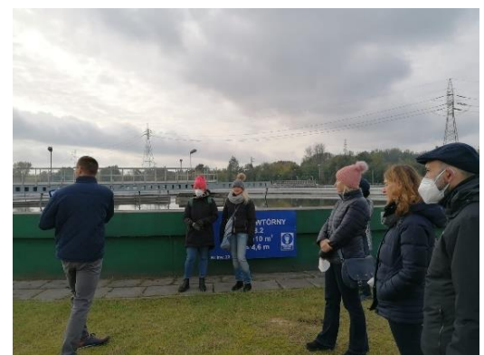
Zapisała: Marjetka Peršon, koordinatorka Erasmus projektov